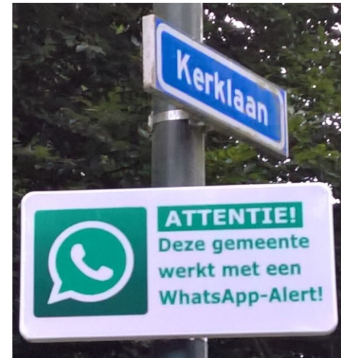
Deze borden zijn aan de randen van Rozendaal geplaatst

De Del (westelijk van de Kraijesteijnlaan) Baron d'Yvoylaan Flugi van Aspermontlaan Geurt Ketslaan