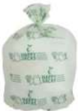
Figuur 2 Voorbeeld Happy Sack

Om iedereen goed op weg te helpen met het inzamelen van etensresten, ontvangt u van de gemeente composteerbare 30 liter afvalzakjes: Happy Sacks. Deze Happy Sacks kunnen dus met etensresten en al zo in de GFT-container. Ze worden gemaakt van natuurlijke materialen zoals zetmeel uit aardappels, suikerriet en mais. Als waarborg voor duurzaamheid vindt u het Kiemplantlogo op iedere zak.