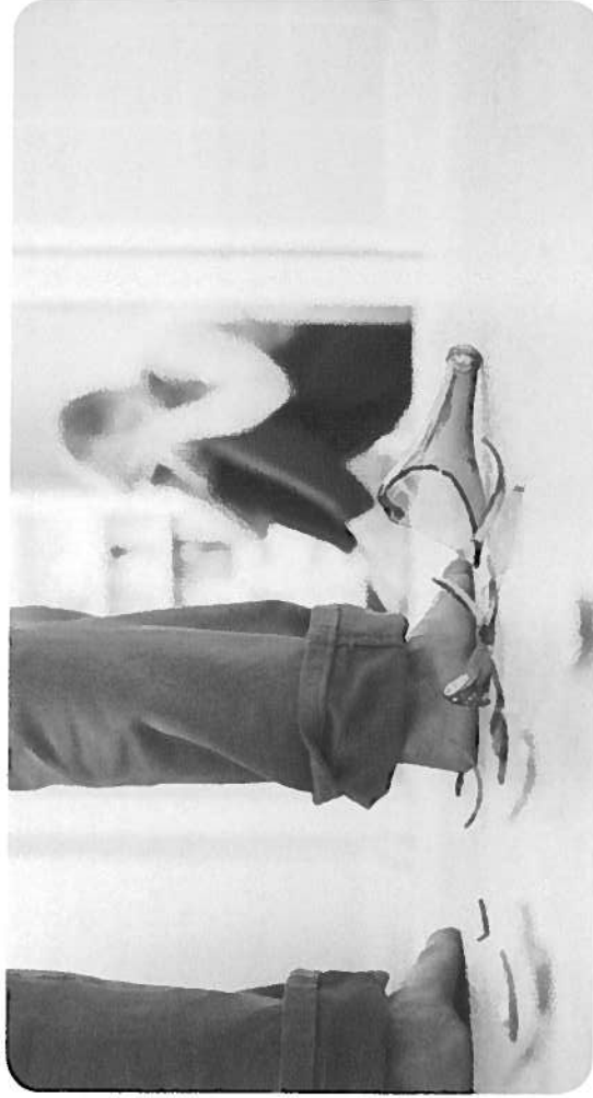
6 'Op weg naar een solide AMHK in Gelderland Midden en Gelderland Noord', 18 maart 2014. Projectgroep vorming basismodel AMHK – www.arnhem.nl/amhk .

Na een melding en zorgvuldige weging daarvan kan het AMHK onderzoeken of er sprake is van kindermishandeling of andere vormen van huiselijk geweld. Als het nodig is brengt het AMHK de hulpverlening op gang en informeert zij de politie en/of de Raad voor de Kinderbescherming en andere betrokkenen. Het AMHK draagt het onderzoek over aan de Raad voor de Kinderbescherming als er sprake is van een voor het kind bedreigende situatie en ouders geen vrijwillige hulp (meer) accepteren. Naast de wettelijke taken zijn er andere werkzaamheden die het AMK en de SHG's op dit moment uitvoeren: uitvoering van de Wet tijdelijk huisverbod, deelname aan screeningsoverleg huiselijk geweld in het Veiligheidshuis, regie(voering) over