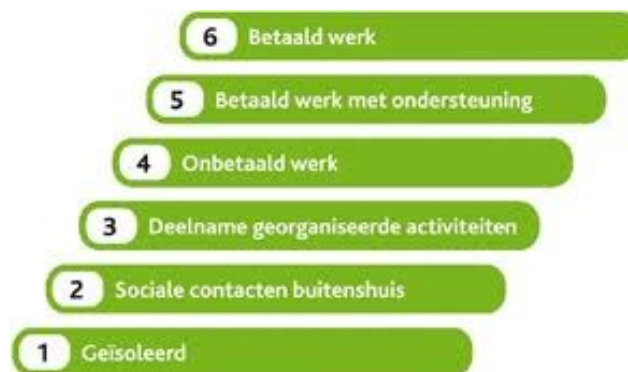
Figuur 2: Participatieladder

Uitgangspunt in onze dienstverlening is dat alle nieuwe klanten starten met een persoonlijk gesprek. De klant en de consulent maken allereerst samen een inschatting van de mogelijkheden en de ondersteuningsbehoefte van de burger. Daartoe beantwoorden zij de volgende vragen: