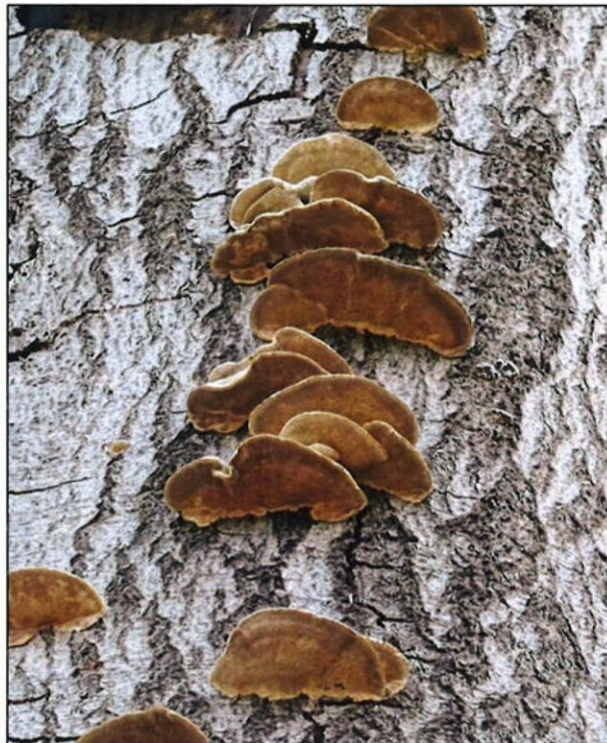
Foto boom 2, stervende beuk met ernstige zonnebrandschade waarop houtschimmels zich hebben gevestigd