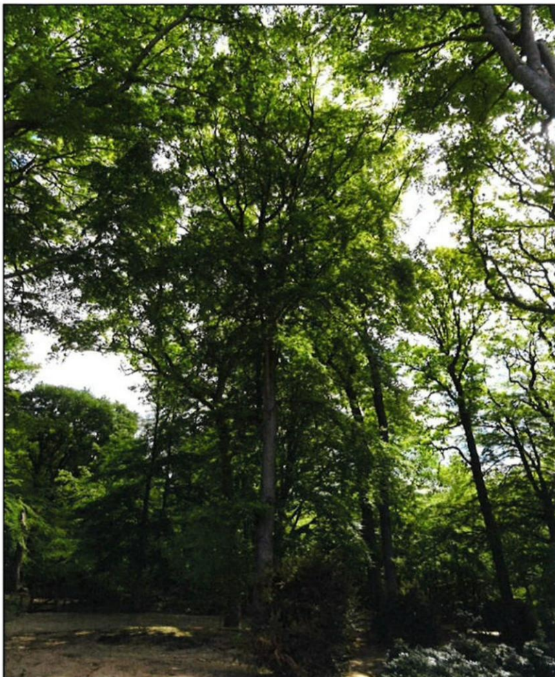
Foto boom 5, deze volwassen beuk heeft nog een voldoende conditie maar wel reeds enige zonnebrandschade opgelopen. Bescherming van de stam met jute is per omgaande geboden wil men deze boom niet ook kwijtraken.

De boom is waardevol en kan met de juiste zorg voorlopig nog behouden blijven. Na het verwijderen van het grove dode hout, in combinatie uit te voeren met het verwijderen van de naburige beuken met zonnebrandschade, is de omgevingsveiligheid ten aanzien van deze omvangrijke volwassen beuk weer acceptabel. Als gevolg van de sterk gewijzigde situatie voor de boom is jaarlijkse inspectie geboden.