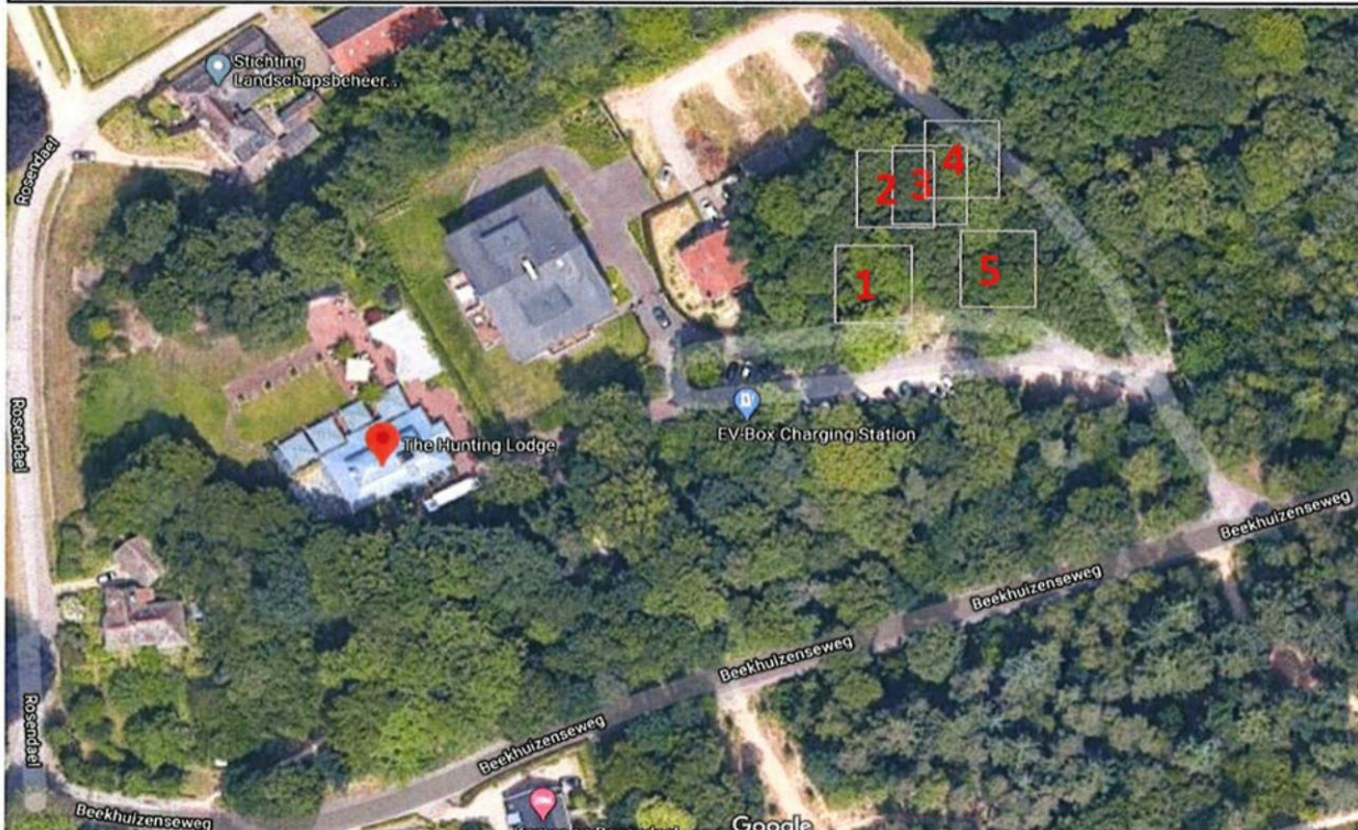
Luchtfoto met nummering gewone beuken. Behalve boom 2 zijn er nog 4 naburige gewone beuken met zonnebrandschade geïnspecteerd. De zonnebrandschade is ontstaan als gevolg van het verwijderen van naburige houtopstanden.