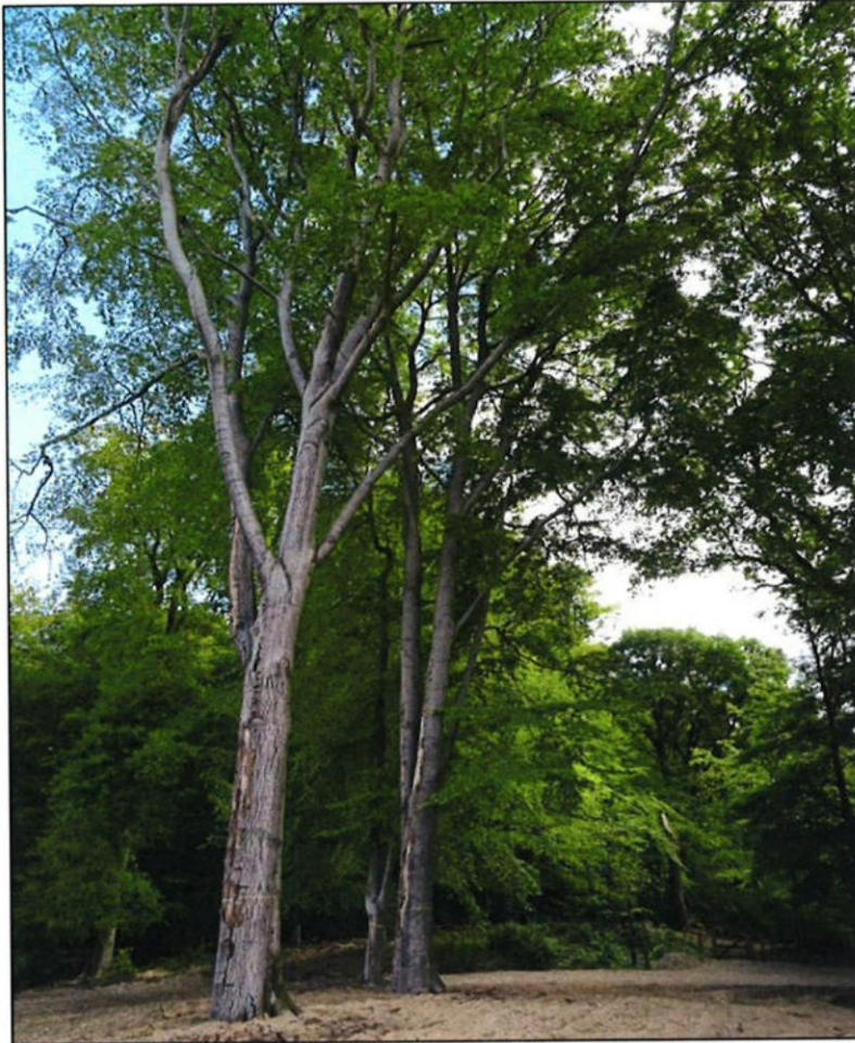
Foto boom 3, deze beuk met dubbele top heeft nog een redelijke conditie maar loopt naar verwachting verder terug als gevolg van ernstige zonnebrandschade waarop zich inmiddels houtschimmels hebben gevestigd.

Teruglopende beuk. De omgevingsveiligheid is ten aanzien van deze grote beuk tijdelijk nog acceptabel. Er is echter sprake van een toenemend takbreukrisico welke gaat spelen zodra beuk 2 is verwijderd. Praktisch gezien wordt derhalve verwijderen in combinatie met boom 2 geadviseerd.