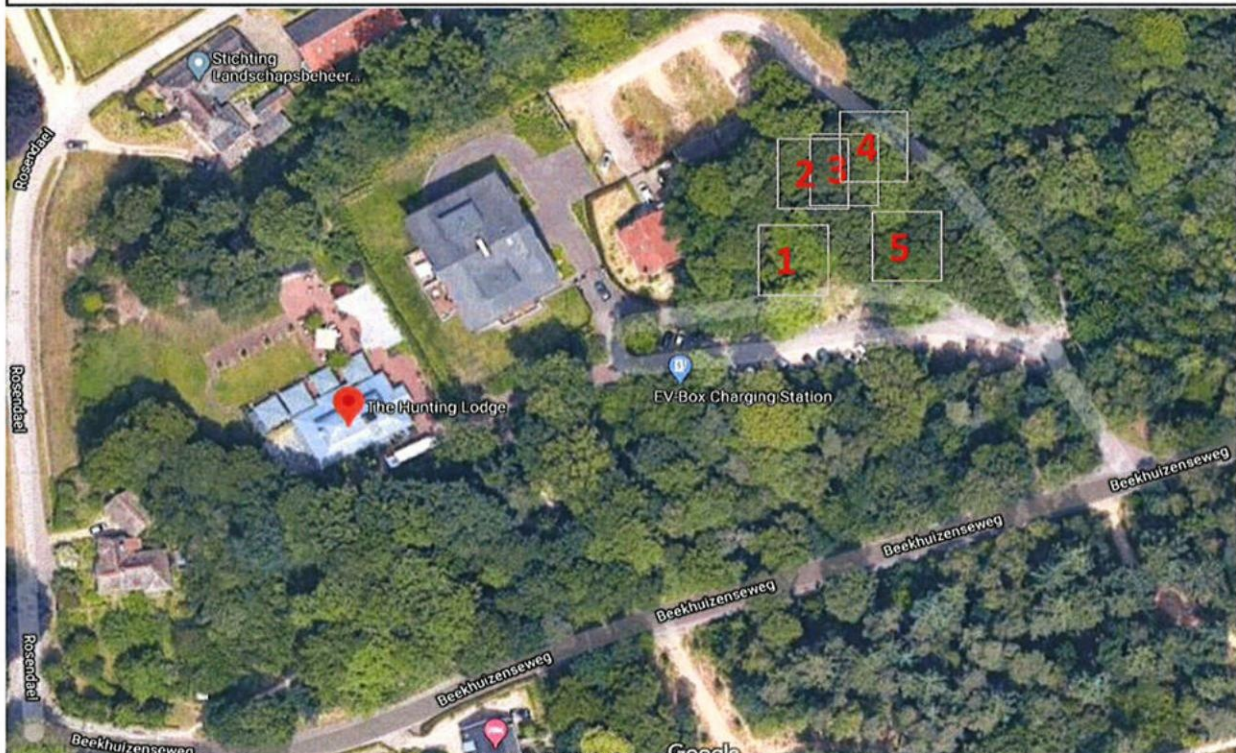
Luchtfoto met nummering gewone beuken. Behalve boom 4 zijn er nog 4 naburige gewone beuken met zonnebrandschade geïnspecteerd. De zonnebrandschade is ontstaan als gevolg van het verwijderen van naburige houtopstanden.