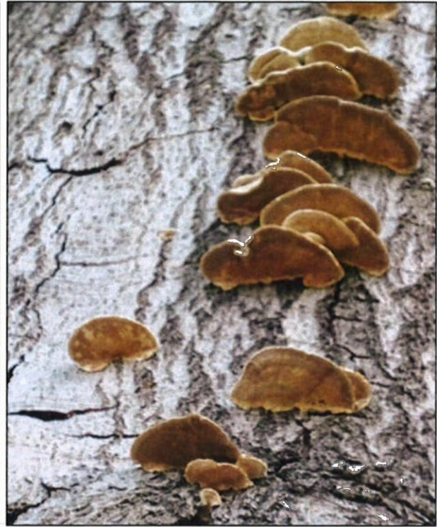
Foto boom 1, stervende beuk met ernstige zonnebrandschade waarop houtschimmels zich hebben gevestigd