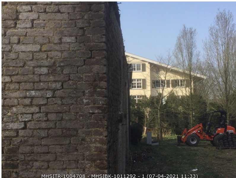
MHSITR-1004708 - MHSIBK-1011292 - 1 (07-04-2021 11:33)