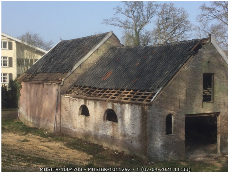
MHSITR-1004708 - MHSIBK-1011292 - 1 (07-04-2021 11:33)