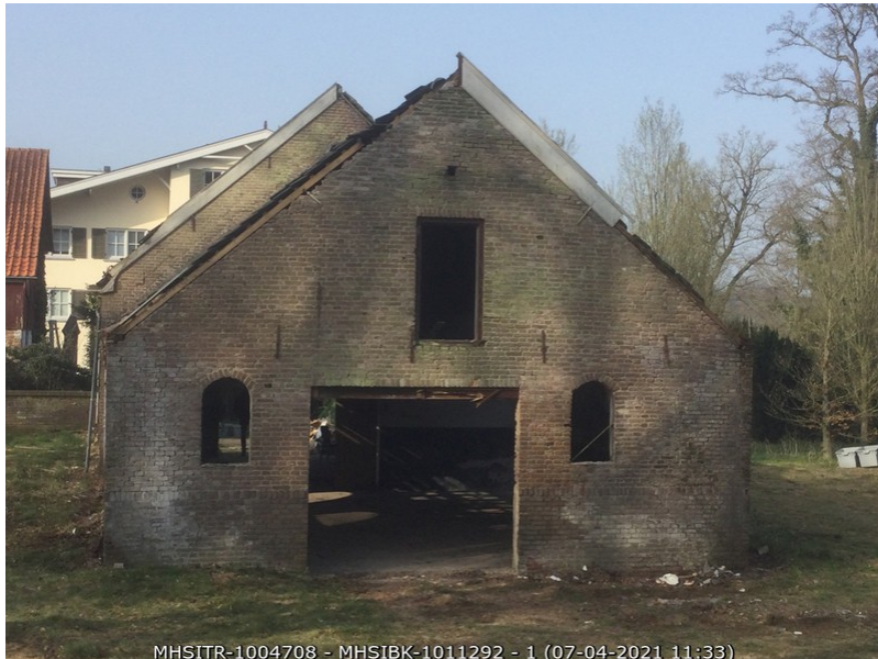
MHSITR-1004708 - MHSIBK-1011292 - 1 (07-04-2021 11:33)