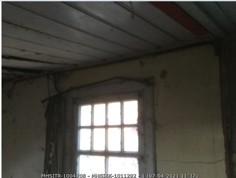
MHSITR-1004708 - MHSIBK-1011292 - 1 (07-04-2021 11:37)