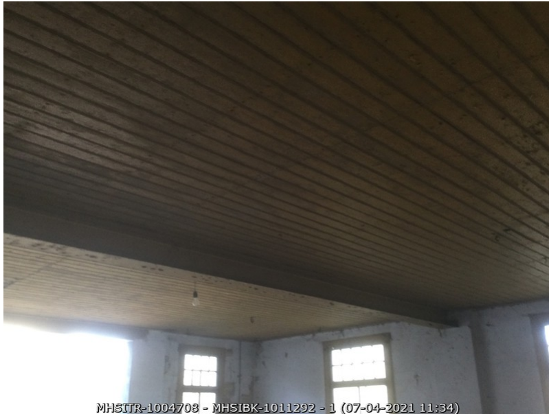
MHSITR-1004708 - MHSIBK-1011292 - 1 (07-04-2021 11:34)