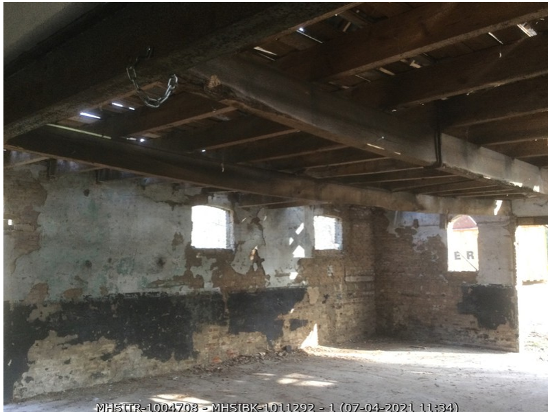
MHSITR-1004708 - MHSIBK-1011292 - 1 (07-04-2021 11:34)