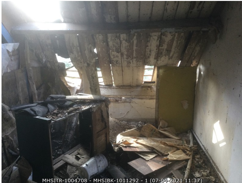
MHSITR-1004708 - MHSIBK-1011292 - 1 (07-04-2021 11:37)