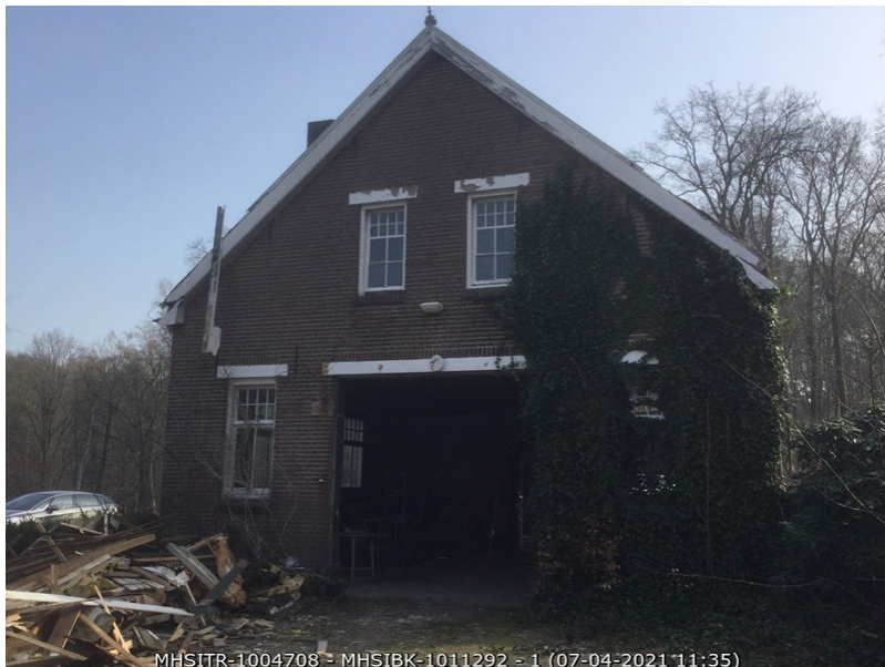
MHSITR-1004708 - MHSIBK-1011292 - 1 (07-04-2021 11:35)