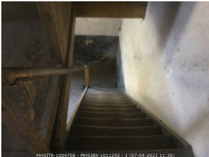
MHSITR-1004708 - MHSIBK-1011292 - 1 (07-04-2021 11:36)