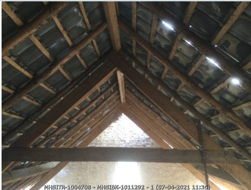
MHSITR-1004708 - MHSIBK-1011292 - 1 (07-04-2021 11:36)