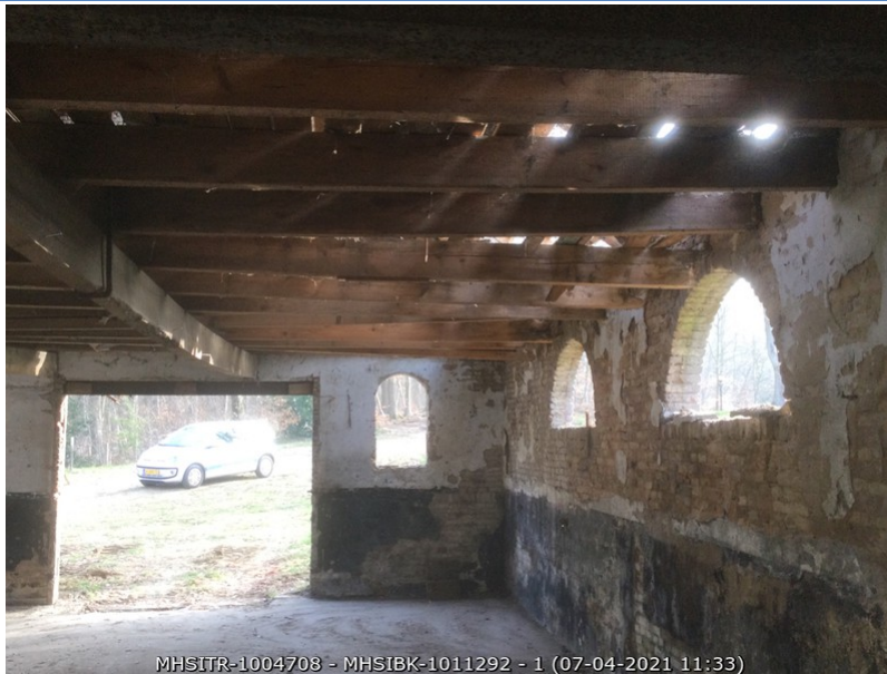
MHSITR-1004708 - MHSIBK-1011292 - 1 (07-04-2021 11:33)