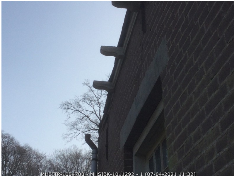
MHSITR-1004708 - MHSIBK-1011292 - 1 (07-04-2021 11:32)