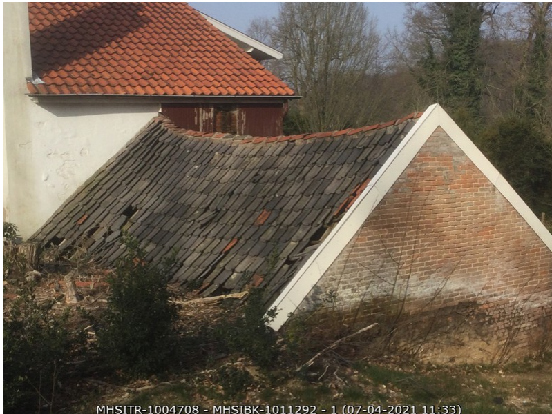
MHSITR-1004708 - MHSIBK-1011292 - 1 (07-04-2021 11:33)