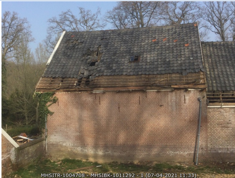
MHSITR-1004708 - MHSIBK-1011292 - 1 (07-04-2021 11:33)