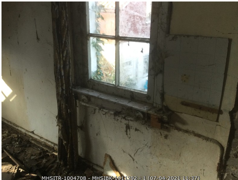
MHSITR-1004708 - MHSIBK-1011292 - 1 (07-04-2021 11:37)