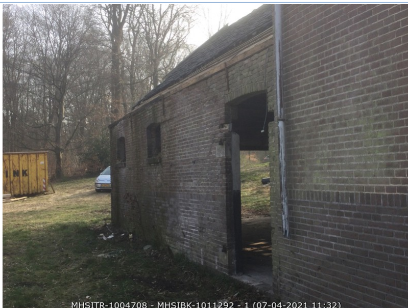
MHSITR-1004708 - MHSIBK-1011292 - 1 (07-04-2021 11:32)