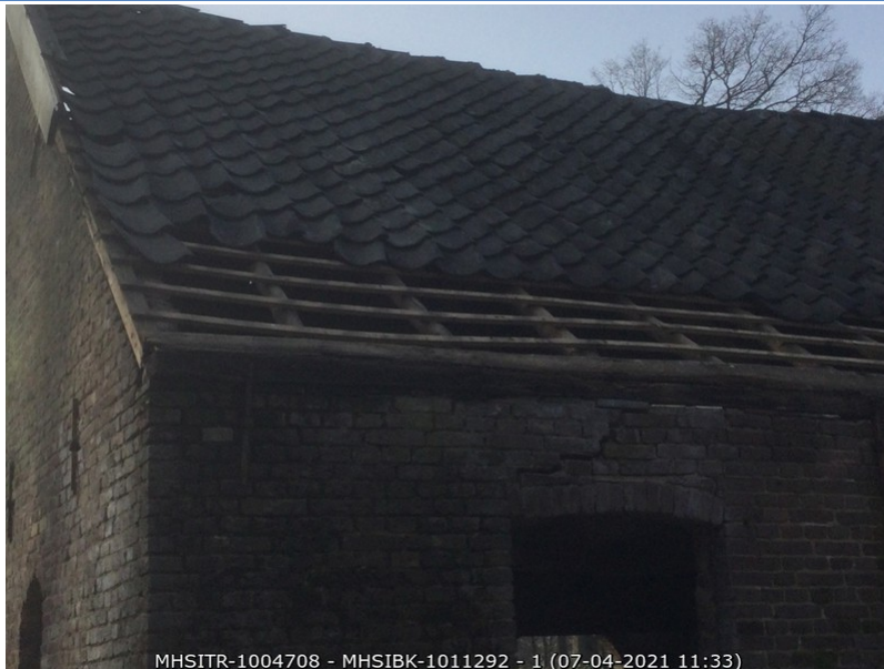
MHSITR-1004708 - MHSIBK-1011292 - 1 (07-04-2021 11:33)