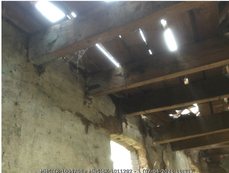
MHSITR-1004708 - MHSIBK-1011292 - 1 (07-04-2021 11:33)