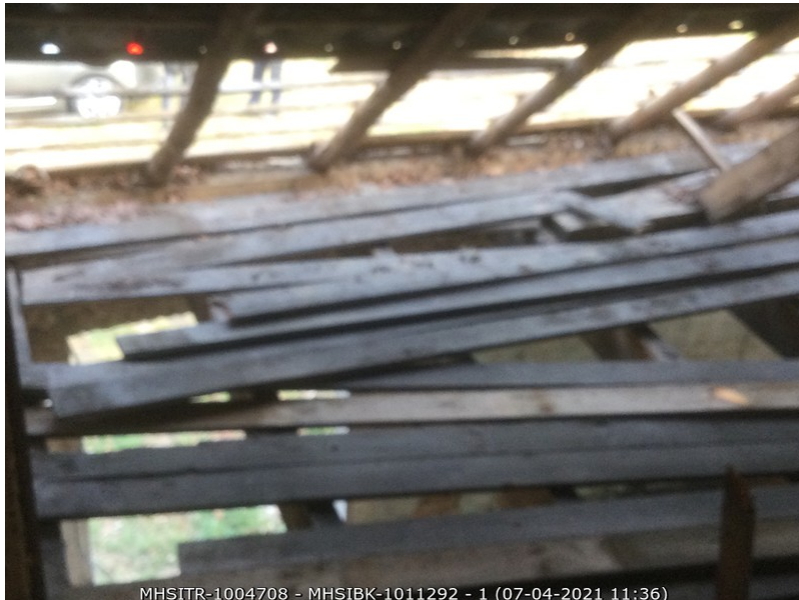
MHSITR-1004708 - MHSIBK-1011292 - 1 (07-04-2021 11:36)