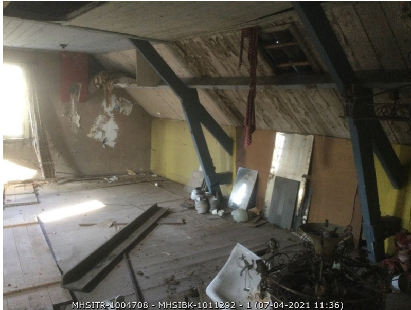
MHSITR-1004708 - MHSIBK-1011292 - 1 (07-04-2021 11:36)