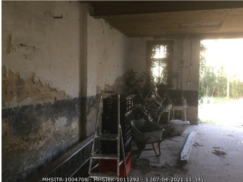
MHSITR-1004708 - MHSIBK-1011292 - 1 (07-04-2021 11:34)