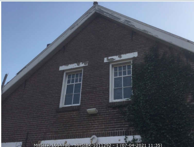
MHSITR-1004708 - MHSIBK-1011292 - 1 (07-04-2021 11:35)