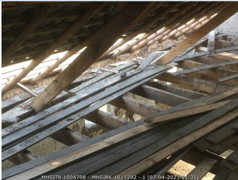
MHSITR-1004708 - MHSIBK-1011292 - 1 (07-04-2021 11:35)