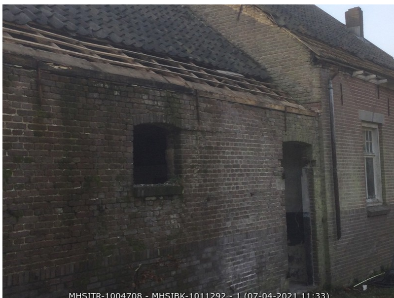
MHSITR-1004708 - MHSIBK-1011292 - 1 (07-04-2021 11:33)