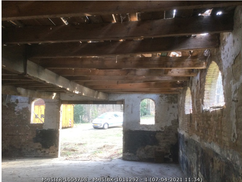
MHSITR-1004708 - MHSIBK-1011292 - 1 (07-04-2021 11:34)