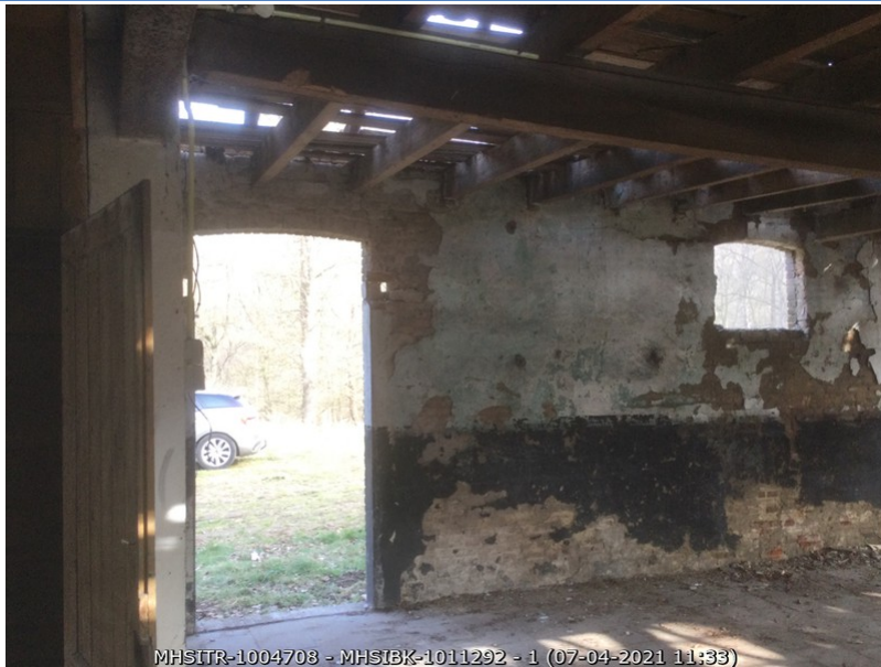
MHSITR-1004708 - MHSIBK-1011292 - 1 (07-04-2021 11:33)