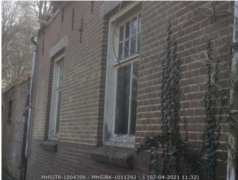
MHSITR-1004708 - MHSIBK-1011292 - 1 (07-04-2021 11:32)