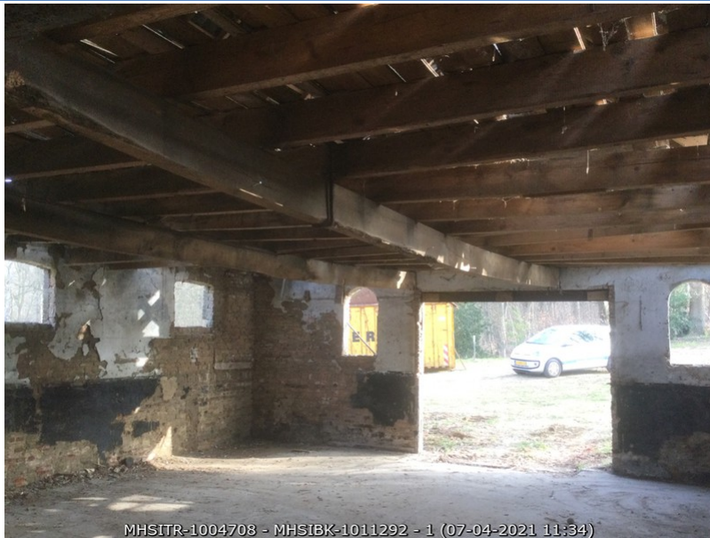
MHSITR-1004708 - MHSIBK-1011292 - 1 (07-04-2021 11:34)