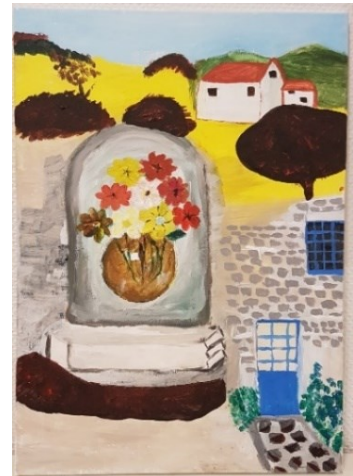
'Huis van mijn leven' van een deelnemer

Kom kijken naar de geïnspireerde werken die ontstaan zijn in dit project.